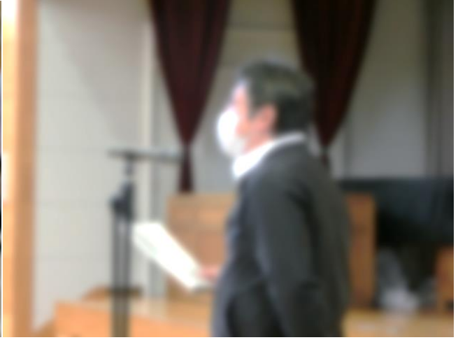
PTA総会〔左：会場の様子 右：PTA会長のあいさつ〕