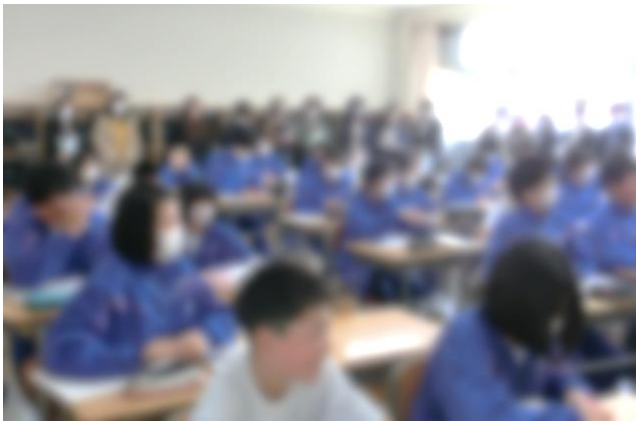
授業参観 1年1組【数学】

おかげさまで、総会では、令和5年度の活動報告、会計決算・監査報告、令和6年度の活動計画案、会計予算案について、無事にご承認いただくことができました。また、昨年度の総会で、規約の改正を承認していただき、今年度から、3部門に分かれていた専門部を、2部門に統合してのスタートの年となりました。具体的には、これまでの『文化部』を『広報部』とし、主に「P T Aだより」の制作・発行を行います。また、これまでの『教養部』と『厚生部』を統合して、新たに『事業部』としました。主に、体育祭での給水や教養的な活動(講演会やワークショップ)の企画・運営を行います。『広報部』と『事業部』としての正式な活動の初年度となります。全校の保護者の皆様のご理解とご協力をよろしくお願いいたします。