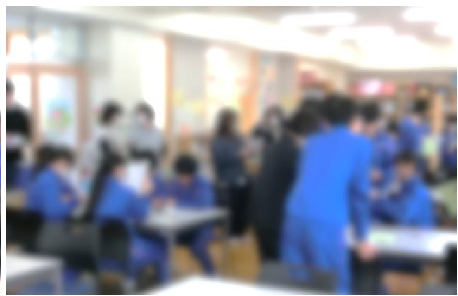
授業参観 3年1組【総合的な学習】