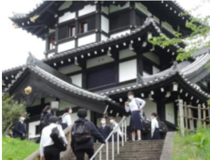
高田城址公園(三本櫓)