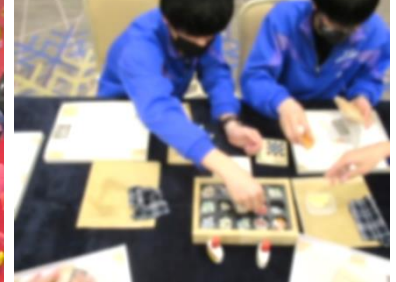
★コースターづくり