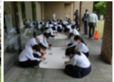
勾玉づくり(県立歴史博物館)