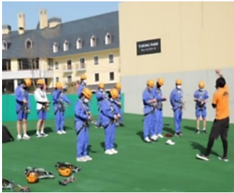
ロッテアライリゾートにて