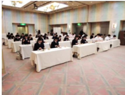
テーブルマナー講習(ホテルセンチュリーイカ)