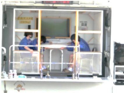
「震度7」の揺れを体験