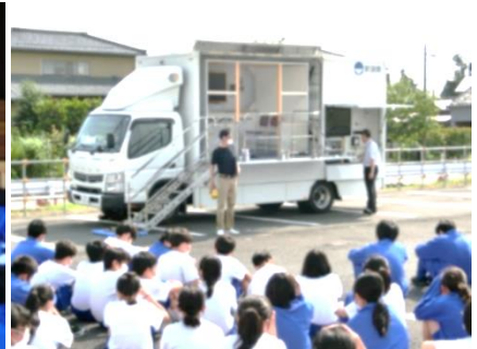
起震車「なまずIII世号」