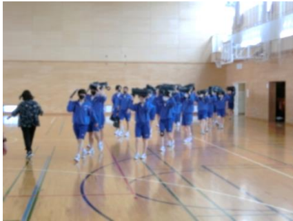
頭を保護し、落ち着いて避難