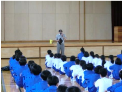
西蒲消防署員のお話