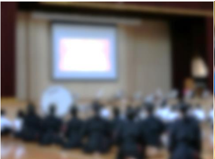
吹奏楽部の演奏紹介(VTR)