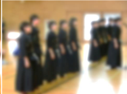
剣道部(男女団体・個人)