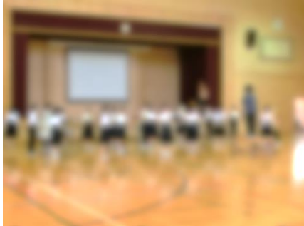
選手入場(吹奏楽部の演奏)

7月15日(土)からの3連休中、新潟県中学校総合体育大会(県総体)が県内各地で行われました。また、15日(土)には、下越地区吹奏楽コンクールが行われました。7月14日(金)に、県総体・吹奏楽コンクールに向けた激励会を開催しました。今年度、吹奏楽部は、中之口中学校と合同でコンクールに出場するため、合同演奏を収録したビデオを上映して、活動紹介をしました。足下の悪い中、お忙しい中にも関わらず、約30名の保護者の方々からご来校いただきました。心より感謝申し上げます。