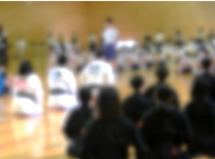
生徒会長 激励の言葉