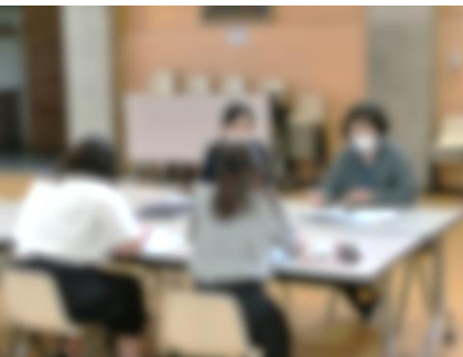
生活・総合学習部会