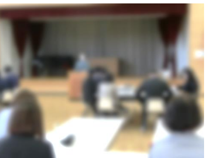
総会（校長あいさつ）