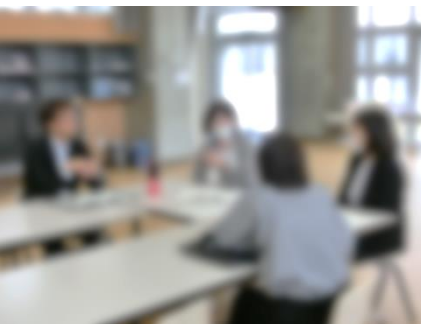
特別支援教育部会